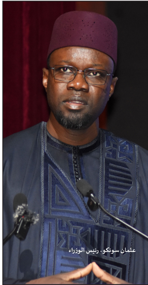
عثمان سونكو، رئيس الوزراء

وفي ختام اللقاء، أكد رئيس الوزراء التزامه بمواصلة الحوار، لكنه شدّد على أن تلبية جميع المطالب النقابية، خاصة على المدى القصير، أمر غير ممكن في ظل الوضع الاقتصادي الراهن. ودعا جميع الأطراف إلى الوقوف إلى جانب الدولة والعمل المشترك من أجل تجاوز الأزمة، مؤكداً أن السنغال لا تفتقر إلى الشركاء المستعدين لدعمها في هذه المرحلة.