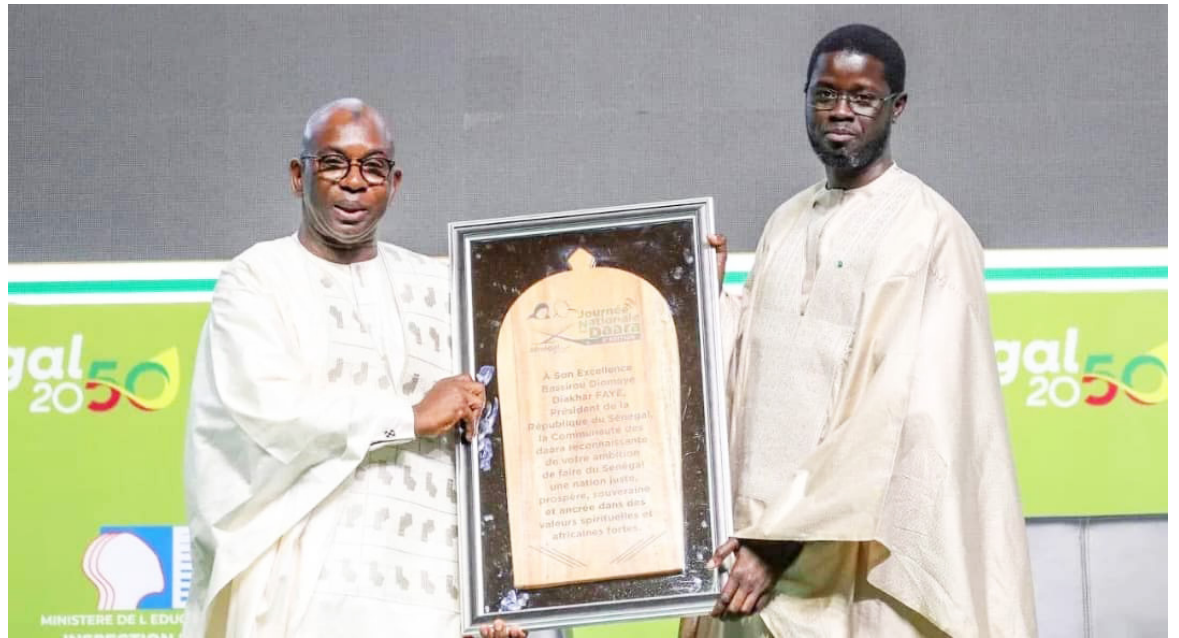
ويكل امتنان، قدمت جماعة «دارا» هدية لرئيس الدولة، باسيرو ديوماي فاي، قدمها وزير التربية الوطنية، مصطفى غيراسي.

- رئيس الجمهورية يدعو لدمج المدارس القرآنية في نظام التعليم الرسمي - الرئيس فاي يحث وزير التربية الوطنية على استكمال الإصلاحات الجوهرية بالتشاور مع جميع الأطراف المعنية، لوضع استراتيجية لتحديث عمل المدارس القرآنية وتطويرها بما يتماشى مع متطلبات العصر. - الرئيس فاي: هدفنا هو دمج «الدارا» بالكامل في النظام التعليمي الوطني، مع تكيفها مع متطلبات المجتمع الحديث.