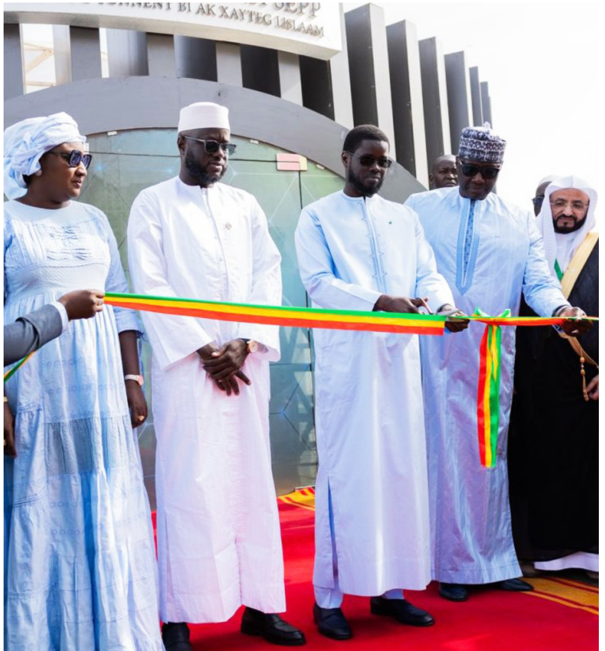
رئيس الجمهورية يبدن متحف النبي محمد

من جهته، أشار الدكتور الزهراني إلى أن هذا المتحف يضم أكثر من عشرين جناحاً متنوعاً، تقدم بطرق مبتكرة عرضاً شاملاً لحياة النبي محمد -صلى الله عليه وسلم- وسيرته العطرة، كما يتيح المتحف للزوار التفاعل، ما يجعل